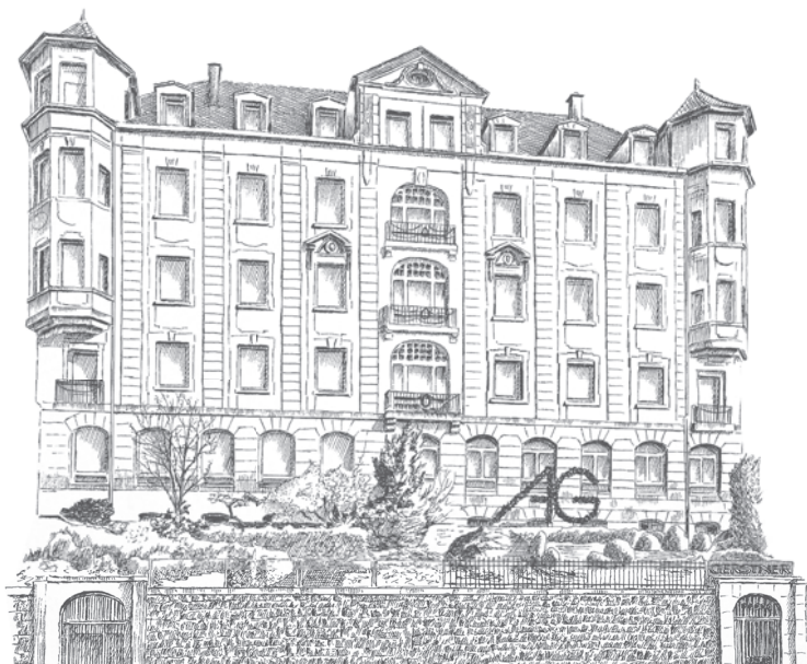
Das Domizil unserer Trauringmanufaktur August Gerstner, erbaut 1902.

Achten Sie auf dieses Siegel in Ihrem Trauring-Zertifikat