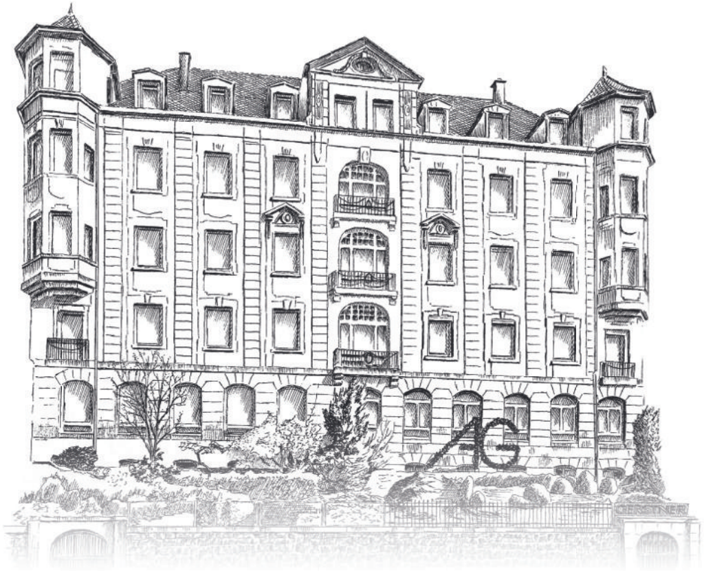
Das Hauptgebäude der Trauringmanufaktur August Gerstner, erbaut 1902.